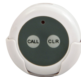
کلید احضار پرستار بی‌سیم