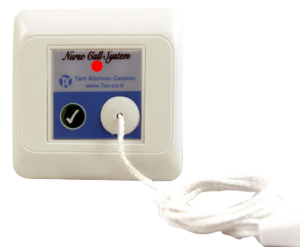
کلید کششی سرویس بهداشتی