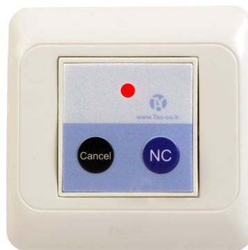
کلید اعلام کد نوزادان