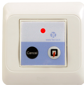
کلید اعلام کد آتش‌نشانی