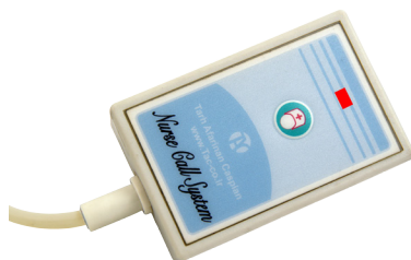
زیربالشی بدون ارتباط صوتی