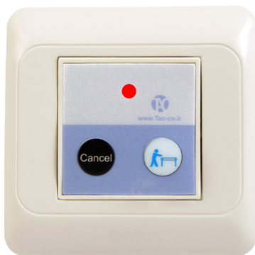
کلید اعلام کد بیماربر