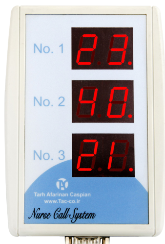
دستگاه مرکزی بدون ارتباط صوتی (مدل رزالین)