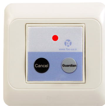
کلید احضار نگهبان