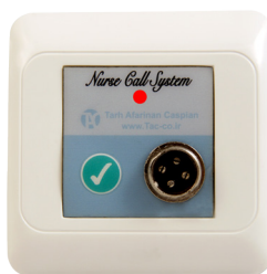
پنل احضار پرستار بدون ارتباط صوتی