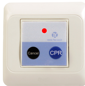
کلید اعلام کد ۹۹